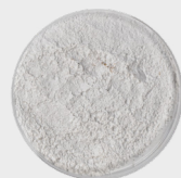
Kaolin/ Porzellanerde (50 %)