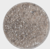
Quarz (25 %)