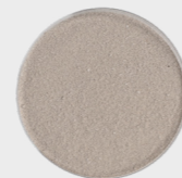
das daraus gefertigte Porzellan- mehl