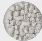
Feldspat (25 %)