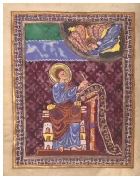
Aus einem Evangeliar, fol 16 v Evangelist Matthäus

um 990, Niedersachsen (Umkreis Corvey), Mainz, ehem. St. Stephan (?) Handschrift und Deckfarben auf Pergament; 21,3x16,7 cm