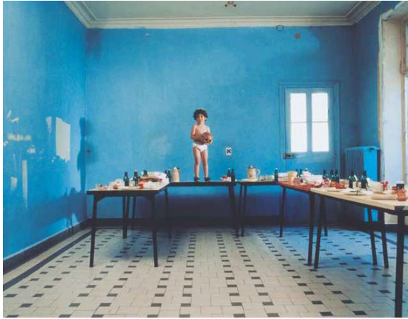
Bettina Rheims/Serge Bramly Das Haus in Nazareth aus dem Zyklus: I.N.R.I.

1998, C-Print montiert auf Aluminium; 129,5x158,5 cm