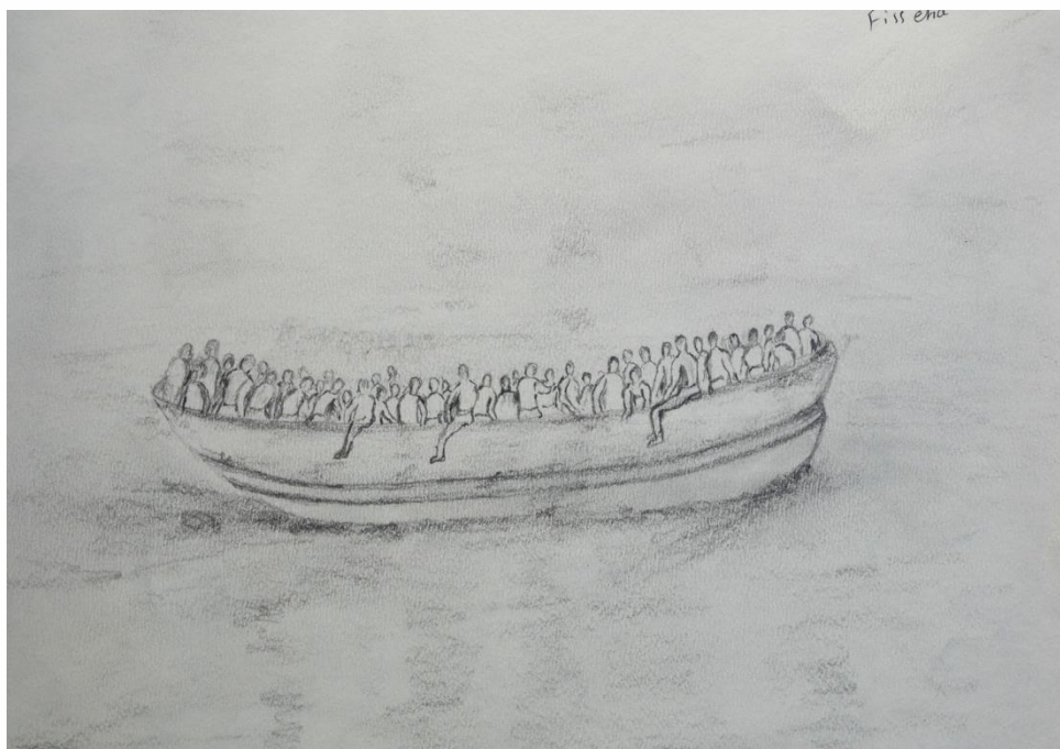
Zeichung von Fisshea (Eritrea)