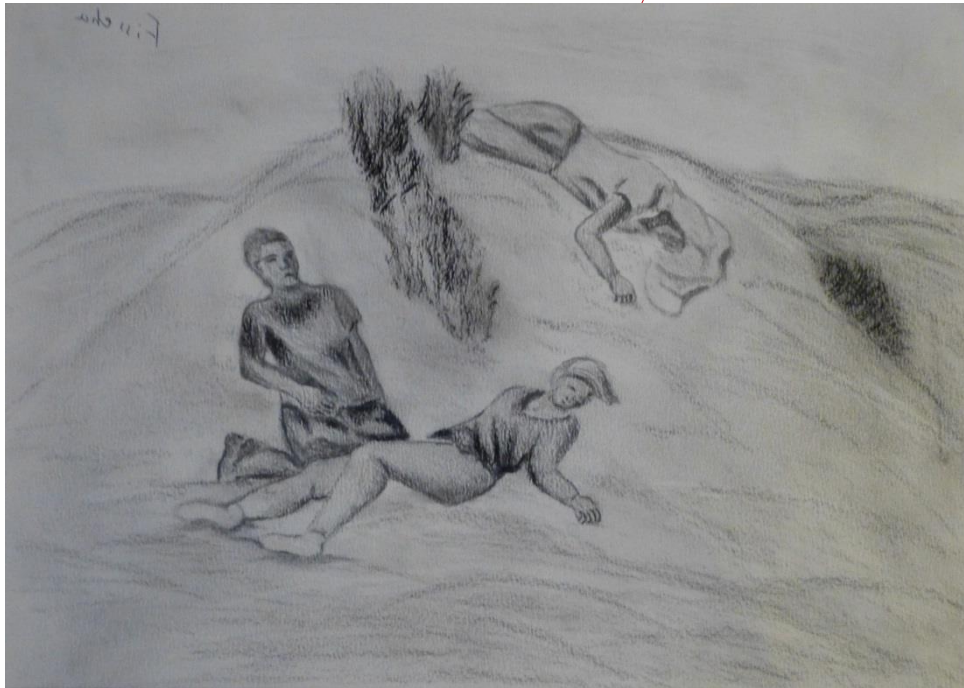
Zeichung von Fisshea (Eritrea)