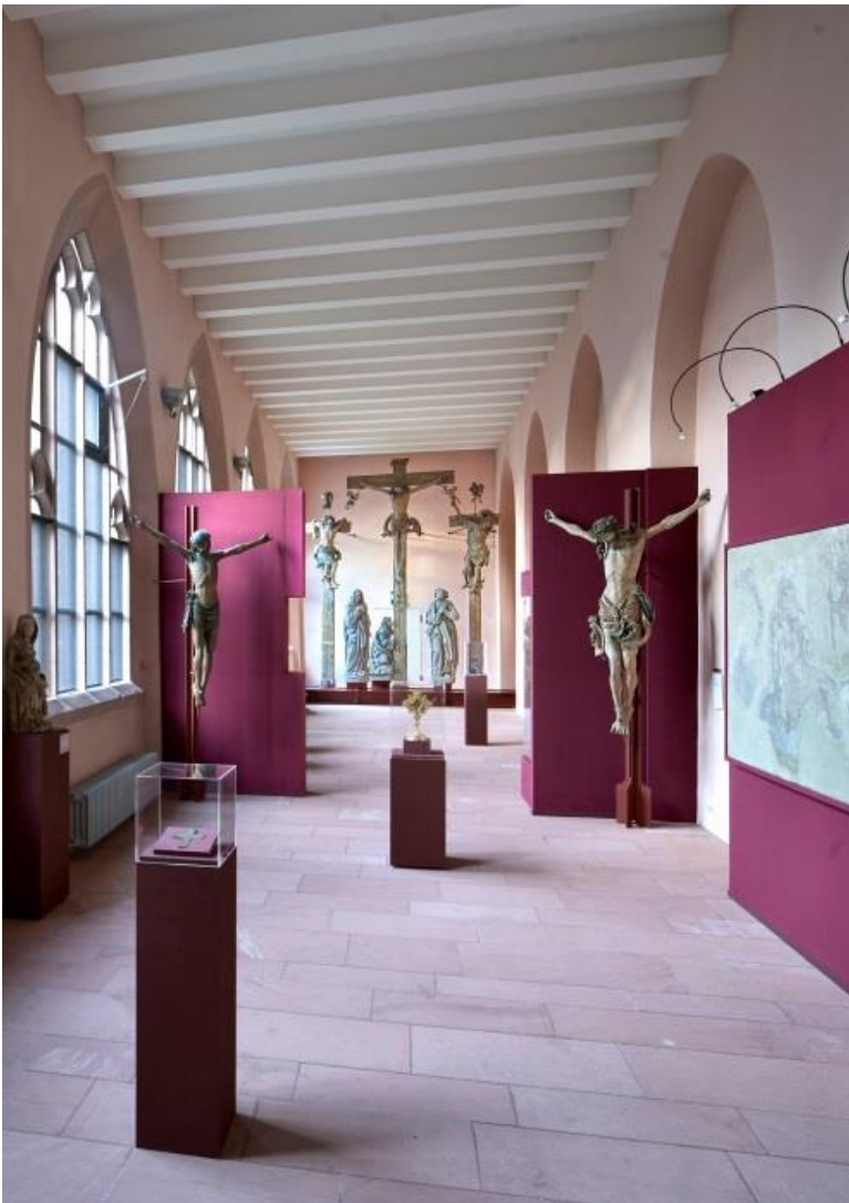
Das neu konzipierte Kreuzgang-Obergeschoss Ansicht des Ostflügels

Bitte beachten Sie, dass eine Verwendung der Pressebilder nur im Zusammenhang mit der Ausstellung und mit Nennung des Urhebervermerks gestattet ist. Druckfähiges Bildmaterial unter www.dommuseum-mainz.de/presse-und-mediathek