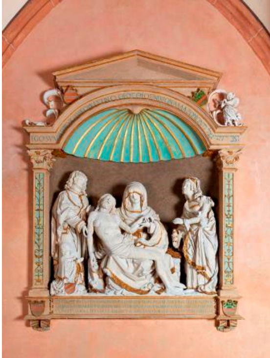
Grabdenkmal des Mainzer Domherrn Johann von Hattstein

wohl Peter Schöner, um 1520 Architekturrahmen grauer Sandstein, Figuren Tuff, erneuerte Fassung, 338 x 263 cm Hohe Domkirche St. Martin, Mainz, Kreuzgang, Südflügel