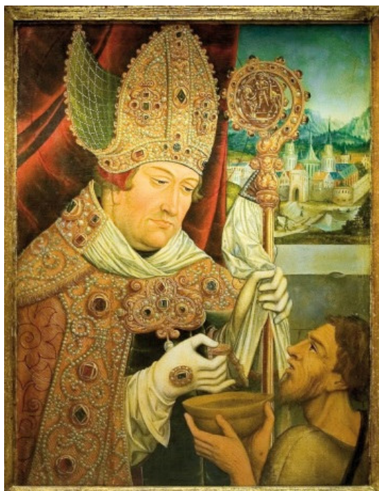
Kardinal Albrecht von Brandenburg als hl. Martin

Bitte beachten Sie, dass eine Verwendung der Pressebilder nur im Zusammenhang mit der jeweiligen Ausstellung und mit Nennung der Provenienz und des Urhebervermerks gestattet ist.