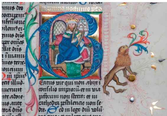
Brevier des Adalbert von Sachsen Detail mit König David